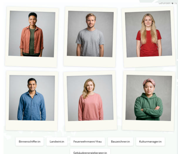
Bonusspiel "Welche Person, welcher Beruf?"